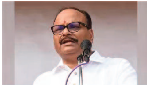
डिप्टी सीएम ने आगे कहा कि संभल में धारा 144 लागू है। दोनों ही नेताओं से अनुरोध है कि वे प्रदेश की कानून

करते हैं। दोनों ही नेताओं को प्रदेश के अमन-चैन से कोई लेना-देना नहीं है। वे सिर्फ अपनी राजनीति चमका कर प्रदेश की कानून व्यवस्था को बिगाड़ना चाहते हैं। जनता भी उनका असली आचरण जानती है। डिप्टी सीएम ने सपा-कांग्रेस से संभल न जाने की विनती की