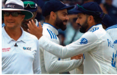
पहले, 59.26 प्रतिशत अफ्रीका दूसरे जबकि अंकों के साथ दक्षिण 57.69 प्रतिशत अंकों के

जा रहे इस मैच को भारतीय टीम किसी भी प्रकार से जीतना चाहेगी। इस मैच में अगर भारतीय टीम हारी तो उसका नंबर एक स्थान हाथ से फिसल जाएगा। साथ ही इससे विश्वटेस्ट चैम्पियनशिप अंक तालिका पर भी प्रभाव पड़ेगा। डब्ल्यूटीसी फाइनल की रस में अभी तीन टीमों हैं। इस सूची में भारतीय टीम 61.11 प्रतिशत अंकों के साथ